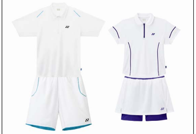
全英オープンモデルウェア

ヨネックスでは、テニス グランドスラム大会「全仏オープン」「全英オープン」に出場する契約プロが着用するベリークールテニスウェアを6月下旬より発売いたします。