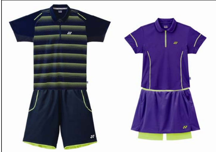
全仏オープンモデルウェア