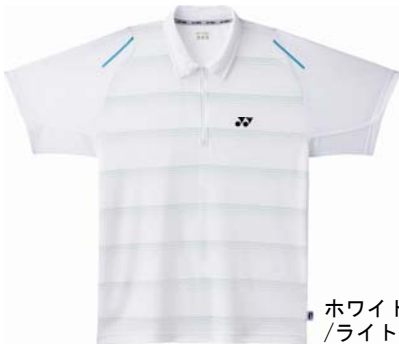
ホワイト /ライトブルー