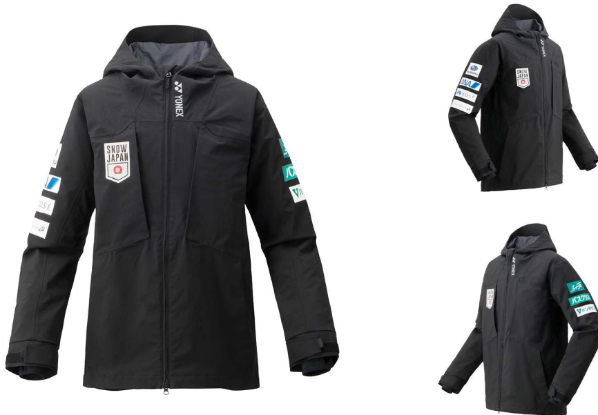
日本代表オフィシャルウェア

ヨネックス株式会社（代表取締役社長：林田草樹）は、公益財団法人全日本スキー連盟（Ski Association of Japan、以下SAJ）の「Division.4」（スキー／スノーボード・ハーフパイプ、スロープスタイル、ビッグエア）のオフィシャルウェアをサプライすることが決定いたしました。スキー・スノーボード日本代表チームにおいて2020/2021シーズンに強化指定選手が着用するオフィシャルウェアを弊社が提供します。