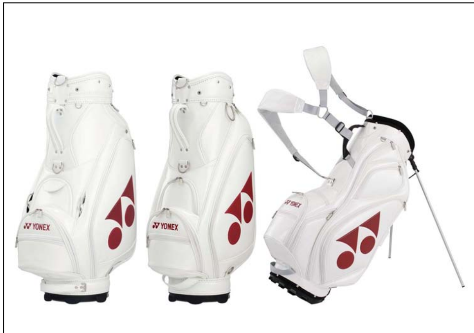
▲左から CB-1901 キャディバッグ、CB-1901C キャディバッグ、CB-1901S スタンドキャディバッグ

ヨネックスは、シンプルなデザインが特徴的な新製品 CB-1901 キャディバッグ、CB-1901C キャディバッグ、CB-1901S スタンドキャディバッグの3モデルを4月下旬に発売いたします。