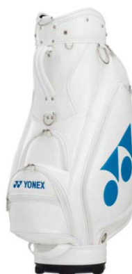
ホワイト/スカイブルー