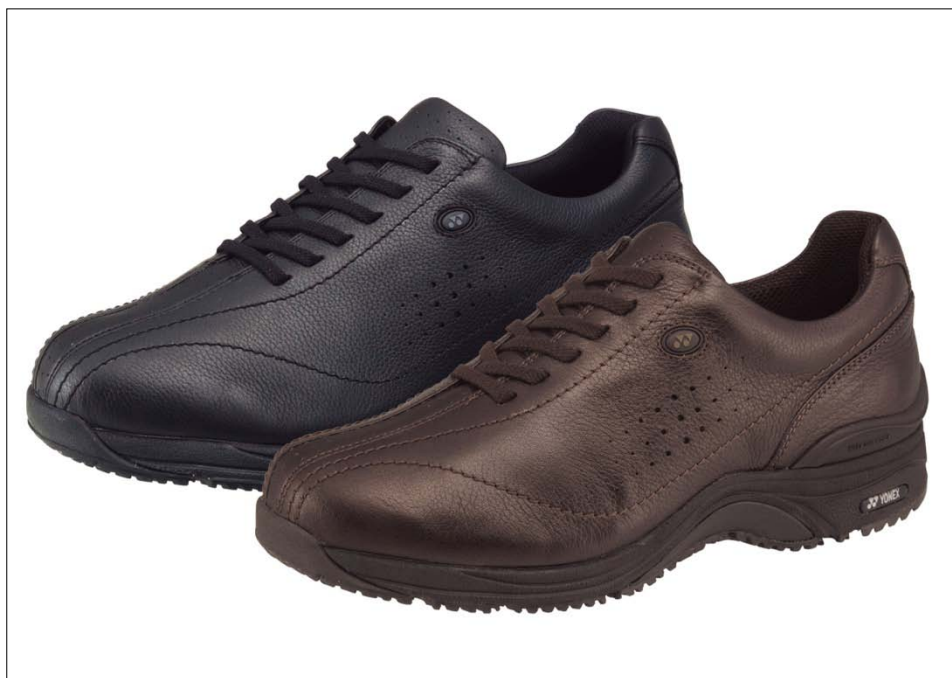
(左)「パワークッション カジュアルウォーク男性用 MC50 ブラック」 (右)「パワークッション カジュアルウォーク女性用 LC50 ブロンズ」

ヨネックス株式会社ではウォーキングシューズのパワークッション カジュアルウォークシリーズの新商品となるロングウォーク用「LC50（女性用）/MC50（男性用）」を3月中旬より発売を開始いたしました。