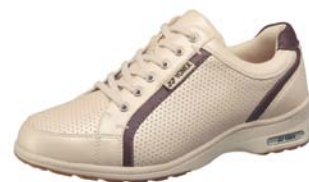
ベージュ/ワインレッド