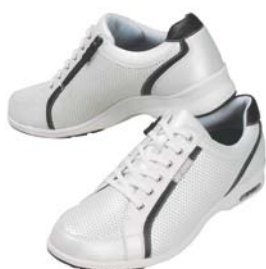
MC47(男性用) ホワイト/ブラック