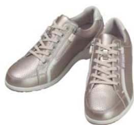
LC47(女性用) プラチナ/ホワイト