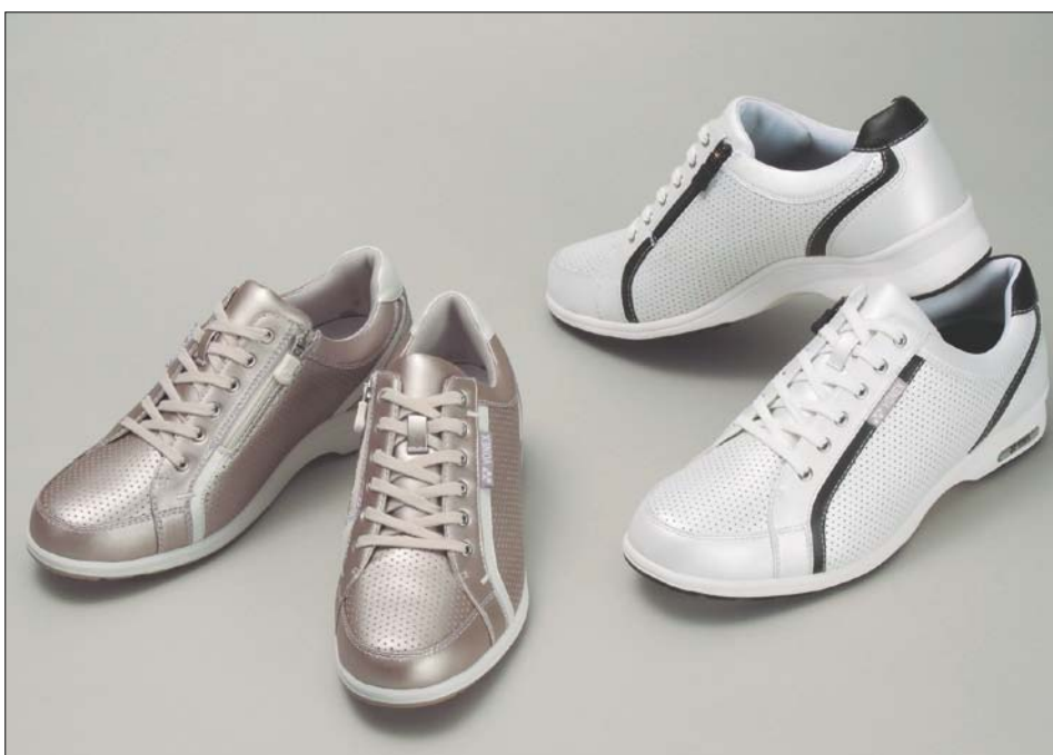
(左)「パワークッション カジュアルウォーク女性用 LC47 プラチナ/ホワイト」 (右)「パワークッション カジュアルウォーク男性用 MC47 ホワイト/ブラック」

ヨネックス株式会社では発売以来ご好評をいただいております、7mの高さから生卵を落としても割れずに約4m跳ね返す衝撃吸収力・反発力を併せ持つ衝撃吸収材パワークッションをソールに施したウォーキングシューズ「パワークッション カジュアルウォーク」の新製品「LC47(女性用)/MC47(男性用)」を3月上旬より発売いたします。こちらの商品は通気防水に優れたウォーキングシューズです。