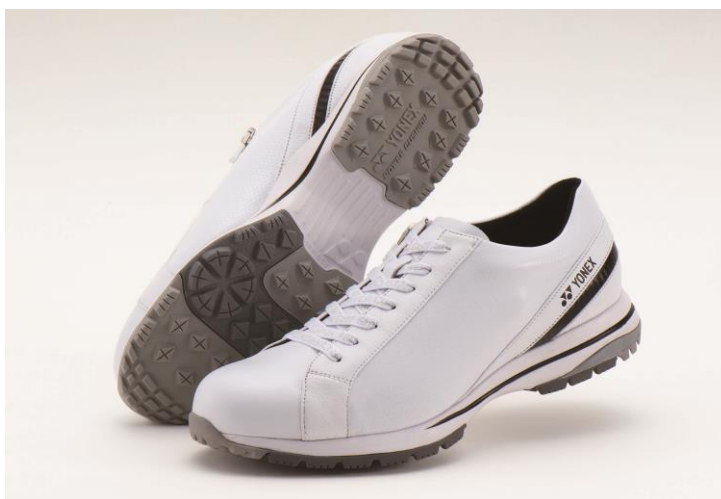
男性用「パワークッション706」ホワイト

ヨネックス株式会社（代表取締役社長：林田 草樹）は、衝撃吸収性と反発力を併せ持つ素材「パワークッション」と、さらに進化させた「パワークッションプラス」を搭載したアベレージゴルファー向けのスパイクレスゴルフシューズ「パワークッション706」、「同706L」を2020年3月下旬より発売いたします。