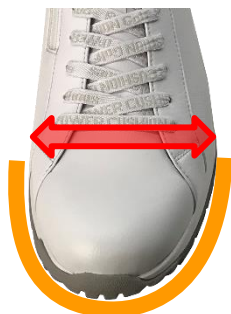
【つま先ゆったり設計】

また、足の立体的な形状に合わせた「あしなり 3D 設計」を採用し、足裏全体で身体を支え、負荷を分散させることで左足が安定し、スウィングのブレを軽減させます。