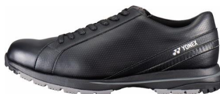
男性用「パワークッション 706」左からホワイト、ブラック