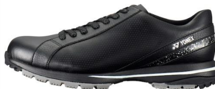
女性用「パワークッション 706L」左からホワイト、ブラック