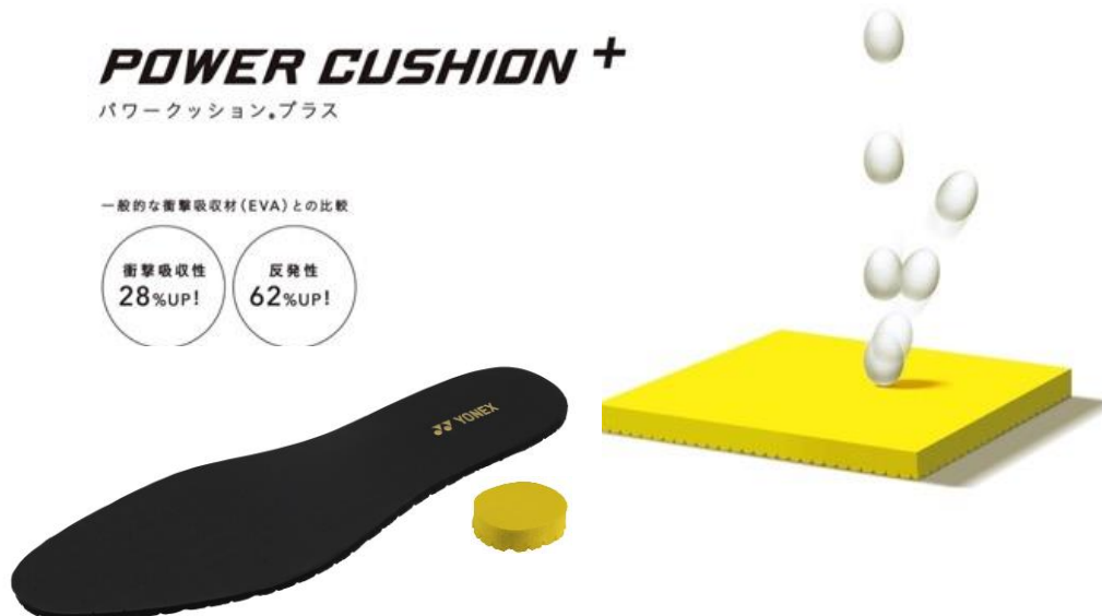
【インソールとかかと部のパワークッションプラス】

「MB-ROYAL」では、インソール裏の全面、かかと部にも内蔵させ、高いクッション性で足裏全体をサポートします。