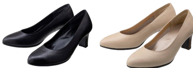
女性用「LB-06」左からブラック、ベージュ