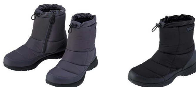
「パワークッション109」左からチャコール、ブラック