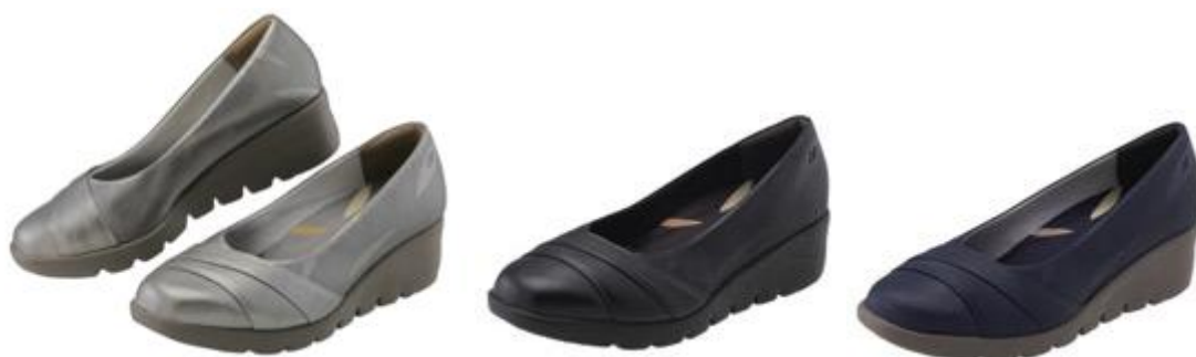
「パワークッションLC106」左からシルバー、ブラック、ネイビーブルー