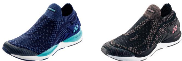
「セーフラン 950 ウィメン」左からダークマリン、ミストピンク