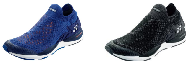
「セーフラン 950 メン」左からインフィニットブルー、アッシュブラック