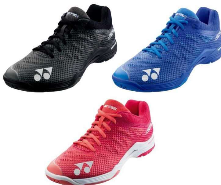
(上段左から)POWER CUSHION AERUS 3 MEN[ブラック]、[ブルー] (下段)POWER CUSHION AERUS 3 WOMEN[ローズ]