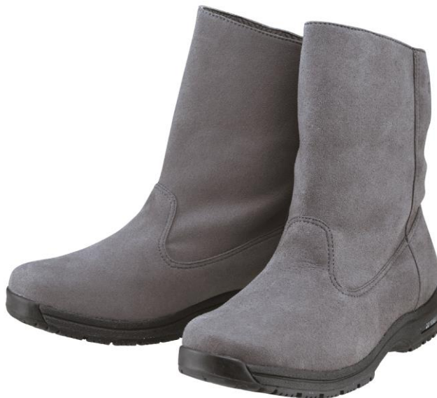
パワークッション LC86(女性用) グレー