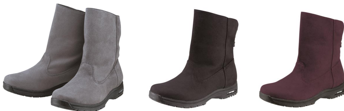
女性用 LC86[左から]グレー、ブラック、ディープパープル