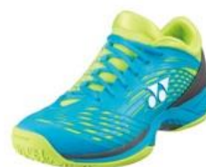
エメラルドブルー