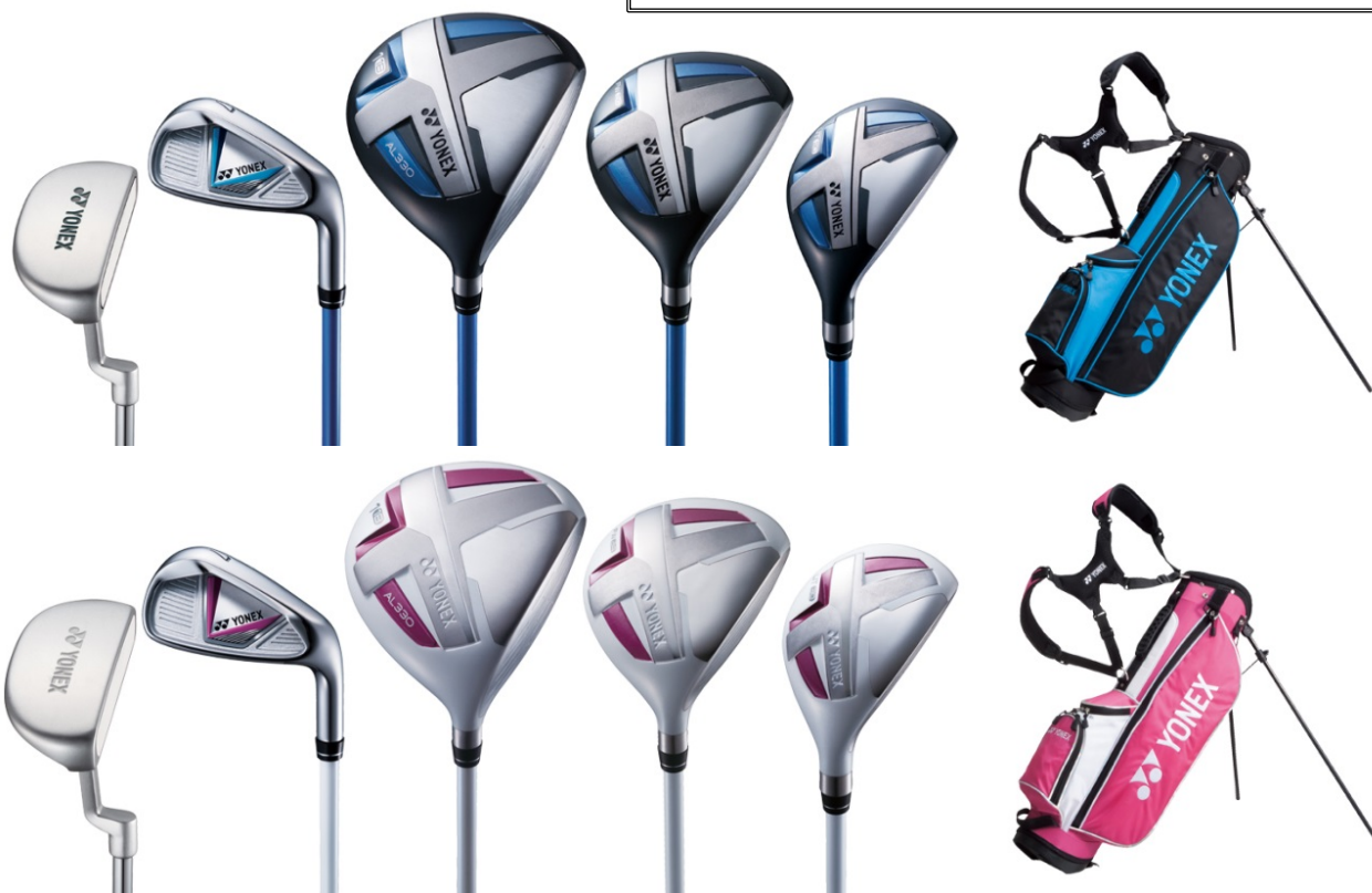
▲YONEX Junior のブルー（上）・ホワイト/ピンク（下）