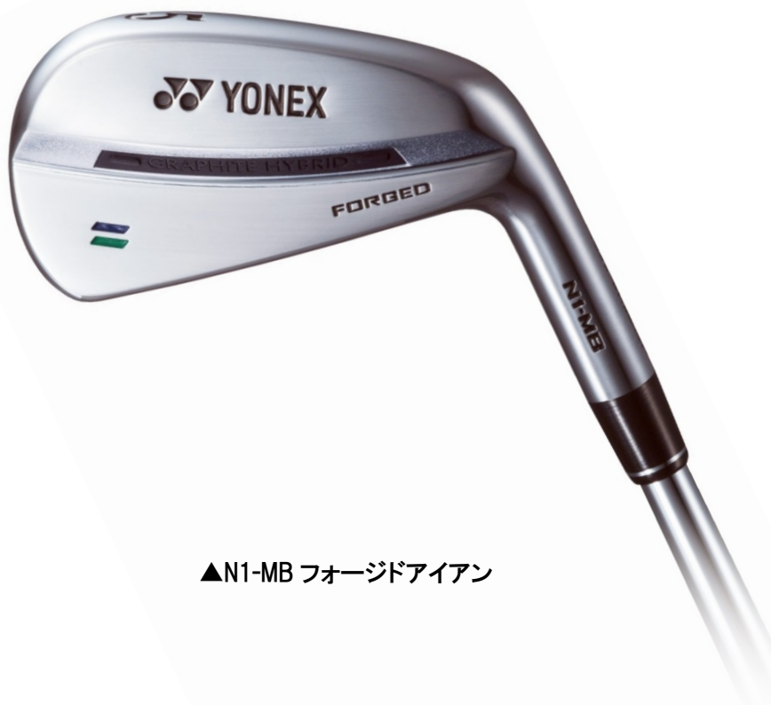
▲N1-MB フォージドアイアン