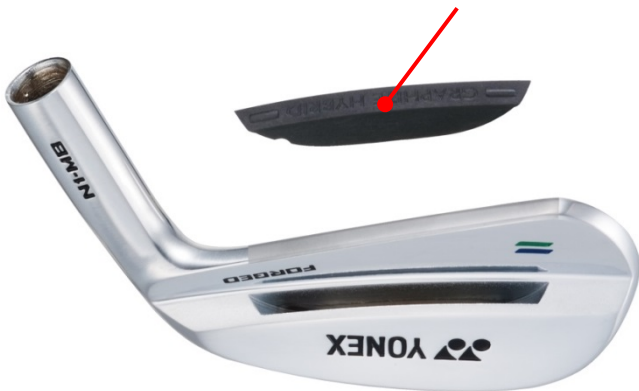
グラファイト制振材