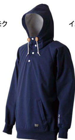
インディゴネイビー