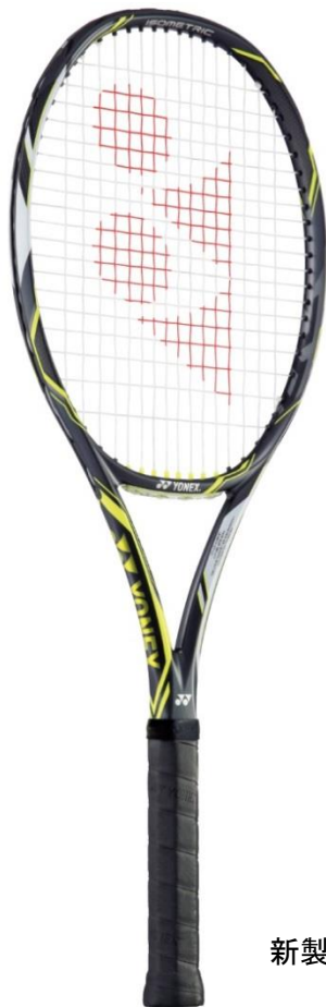
新製品テニスラケット「EZONE DR 98」