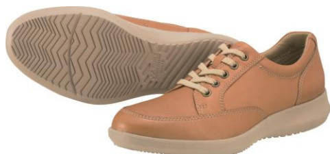
男性用 MC75 キャメル