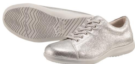
女性用 LC75 シルバー