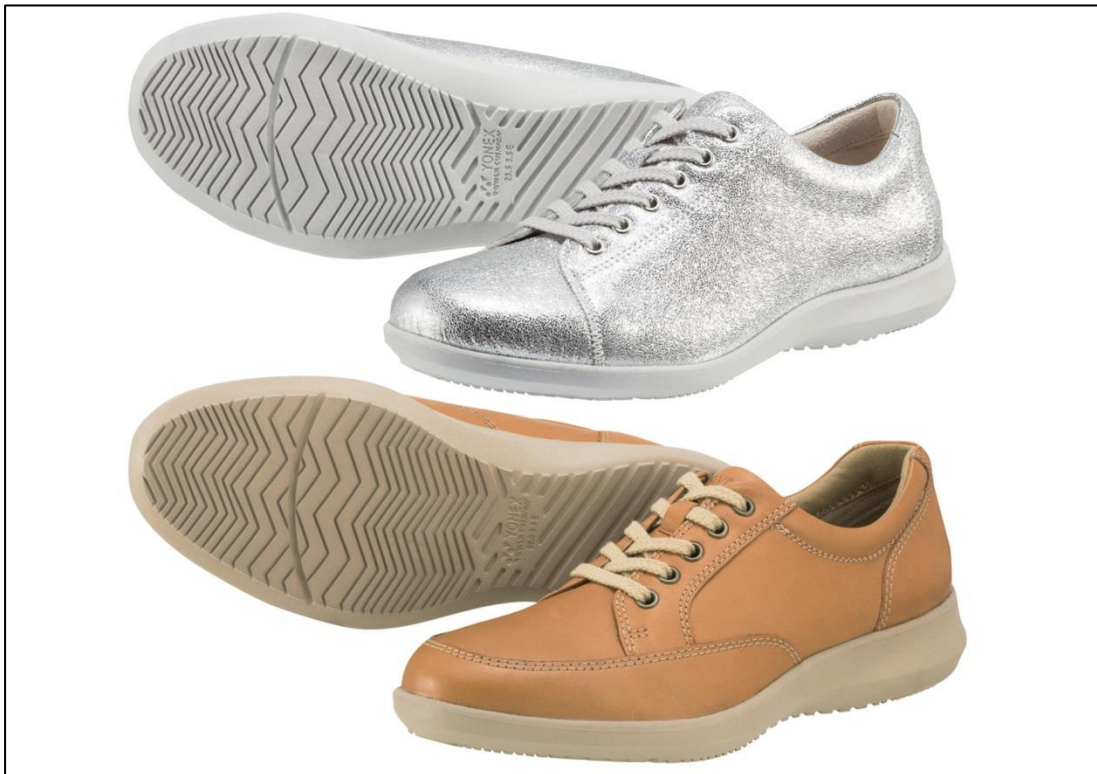
(上)女性用 パワークッション LC75 シルバー (下) 男性用 パワークッション MC75 キャメル