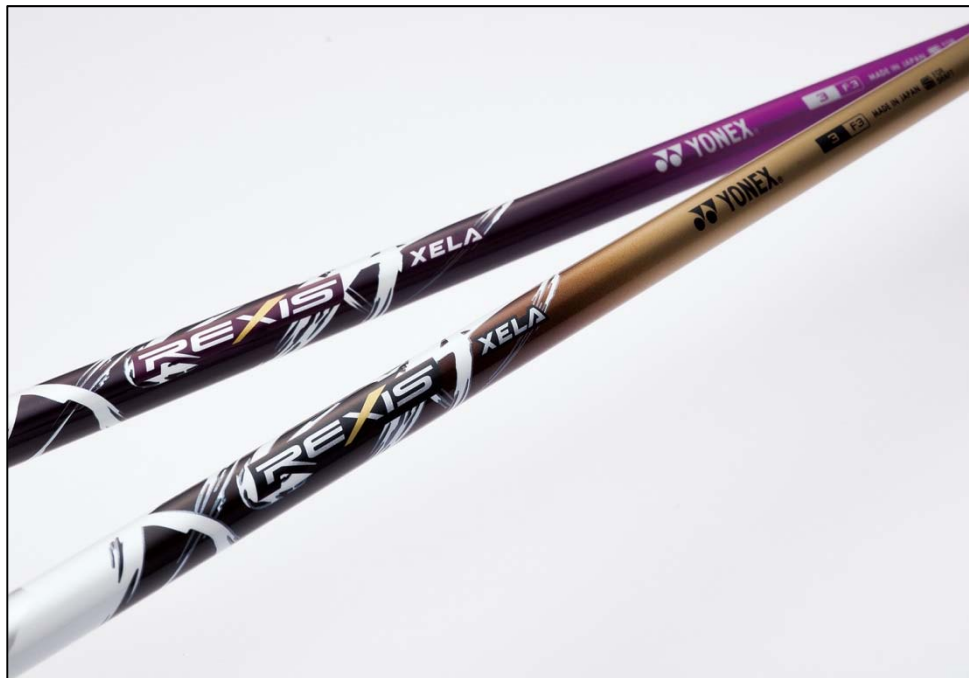
▲世界最軽量 31gのシャフト「REXIS XELA(レクシス キセラ)」 パープル（上）とゴールド（下）

ヨネックス株式会社（代表取締役社長：米山勉）は、カスタムフィッティングオーダーでご好評をいただいておりますヨネックス製ナノメトリック複合グラファイトシャフト「REXIS XELA(レクシス キセラ)」にこの度、世界最軽量 ※1 31gの新スペックを2014年9月下旬に発売いたします。