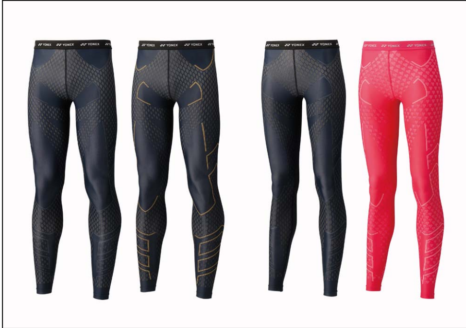
▲左から UNI ロングスパッツのブラック、ブラック/ゴールド(STB-A2007)、Women ロングスパッツのブラック(STB-A2508)、ブライトピンク(STB-A2509)

ヨネックス株式会社(代表取締役社長: 米山勉)は、コア(体幹)のバランスを整えパフォーマンスを高める高機能アンダーウェア「マッスルパワーSTB」のアスリートモデルで展開しているロングスパッツのニューモデルを2014年12月中旬より発売しています。