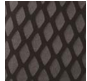
スタビリティラバー